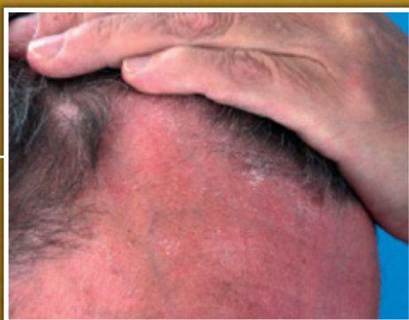
Vyrážky na tvári